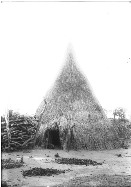
Een originele hut van de Azande-stam, levend in de streek van Yakuluku.

We waren gekomen bij de ruilverkoop aan de grensstreek waarbij bijvoorbeeld peper uit Kongo en Engelse fietsen uit Soudan via een smokkelroute in- en uitgevoerd werden.