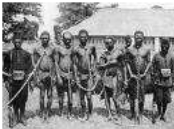
Weermacht soldaten bewaken arbeiders van rubberplantages. Ten tijde van Gombari ging het er toch al heel wat menselijker aan toe.

15u25! "Mon Colonel, on est prêt pour le tir" verkondig ik stoicijns van op de toren van mijn gevechtswagen. Ik heb, zoals het 'moet', mijn verrekijker in de hand en begin de aan de bemanning aangeleerde schietgegevens klaar en duidelijk te bevelen, luid genoeg als een uitlaatklep voor mijn opgekropte misnoegdheid. Het moet ongeveer zo geklonken hebben: "Bombe APC ... une!" Uit de mond van het met vele zweetdruppels bedekt gelaat van de kanonnier een nauwelijks hoorbaar "booooo;ééé,péééé; ssss;OENE" "Chargez!" Antwoord: "SSSJAAR-ZEE". Vervolgens de 'afstand', de 'richting' en tenslotte het verlossende bevel: "FEU!" Uit de gevechtsruimte klinkt nog stiller: "AKOKI tè (het gaat niet), mon Lutenant". Achter mij klinkt terug de berispende stem van de inspecteur: "Dois je vous donner un coup de main,oui?" Waarop ik nog luider schreeuw "Feu!" Nogmaals klinkt de als het ware smekende stem van de kanonnier "Mon lutenant,akoki tè, tè". Zuchtend draai ik me om naar het trio: "Mon Colonel, je crois que c'est un feu..." Verder kom ik niet met de uitleg,want op hetzelfde ogenblik suist met een iedereen verrassende luide knal het projectiel weg, over de uitgestrekte savanne heen naar een onbekend doel waar het met een