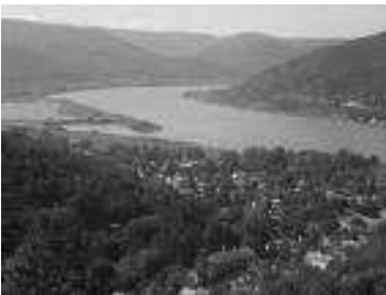
De donauknie in Visegrad