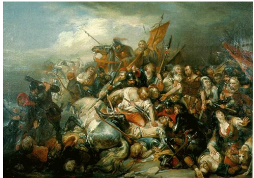
Nicaise De Keyser: De slag der Gulden Sporen