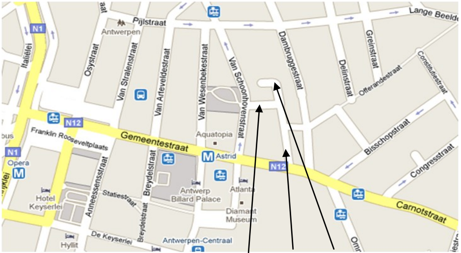
Schaafstraat Lange en Korte Winkelhaakstraat