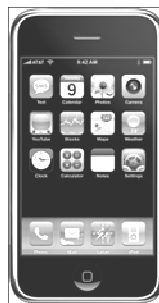
iPod Touch (239 à 409 €)

Apple geeft al zijn consumentenproducten het voorvoegsel 'i'. Wat die "i" betekent heeft Apple echter nooit gezegd: internet? individueel? - ik houd het op 'interactief'. Van de naam iPod is ook de term podcast afgeleid, een geluidsopname die gedownload kan worden. Een variant hierop is de videopodcast , afgekort tot vodcast .