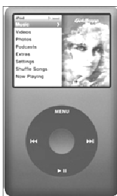
iPod Classic (±200 €)