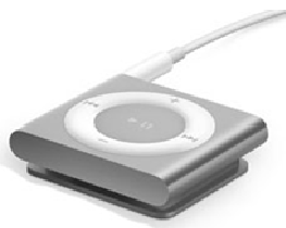
iPod Shuffle (kost ±50 €)