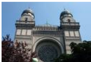
De synagoge in de Bouwmeesterstraat

Zoals ik reeds eerder liet verstaan geeft dit alweer een idee van hoe groot het bereik van dit Zuidkasteel wel was.