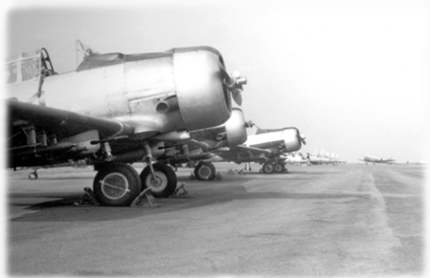
Onze Harvards in Ndjili, met Fouga's en een Dakota op de achtergrond