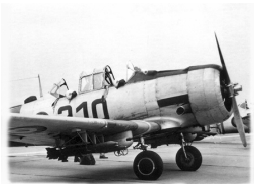
Een T-6A met gunpods en rockets.

We schrijven begin 1960, enige maanden voor de onafhankelijkheid van Congo. Mede door de onlusten in Kinshasa in 1959 had België beslist om een twaalfstal Harvards van de basis van Kamina te bewapenen met vier mitrailleurs, kaliber .303, ondergebracht in 2 pods onder de vleugels. Tevens werden de toestellen uitgerust met launchers voor zes rockets en aanhechtingspunten voor twee General Purpose (GP) bommen. Deze configuratie was identiek aan deze die door Franse Luchtmacht werd gebruikt in Algerije. De bewapende toestellen waren van het type 4 K en worden in dit dagboek aangeduid als T-6A.