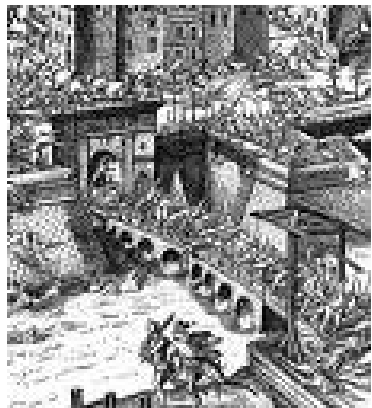
Parma valt Antwerpen binnen

Zij duidt op het schip de Hoop , dat hier omtrent zijn afreeding kreeg ter vernieling der Farnesebrug op de Beneden-Schelde in 1585. De naam zinspeelt op de hoop der belegerden.