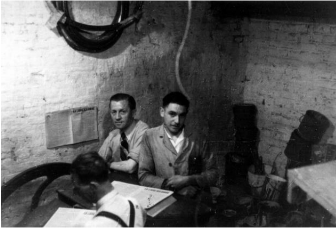
Oorspronkelijke legende: De illegale « Libre Belgique ». Foto genomen in 1944 in de clandestiene drukkerij, 87 rue St. Gilles in Luik

Deze laatsten hergroeperen zich met name in het Belgisch Legioen, een beweging gegroeid uit de militaire groepering die in de herfst van 1940 de Koning wou ondersteunen en die zich vanaf 1941 hervormt in een organisatie bedoeld om steun te bieden aan de Angelsaksische geallieerden ter voorbereiding van de bevrijding. Vanaf 1944 gaat ze verder onder de naam het