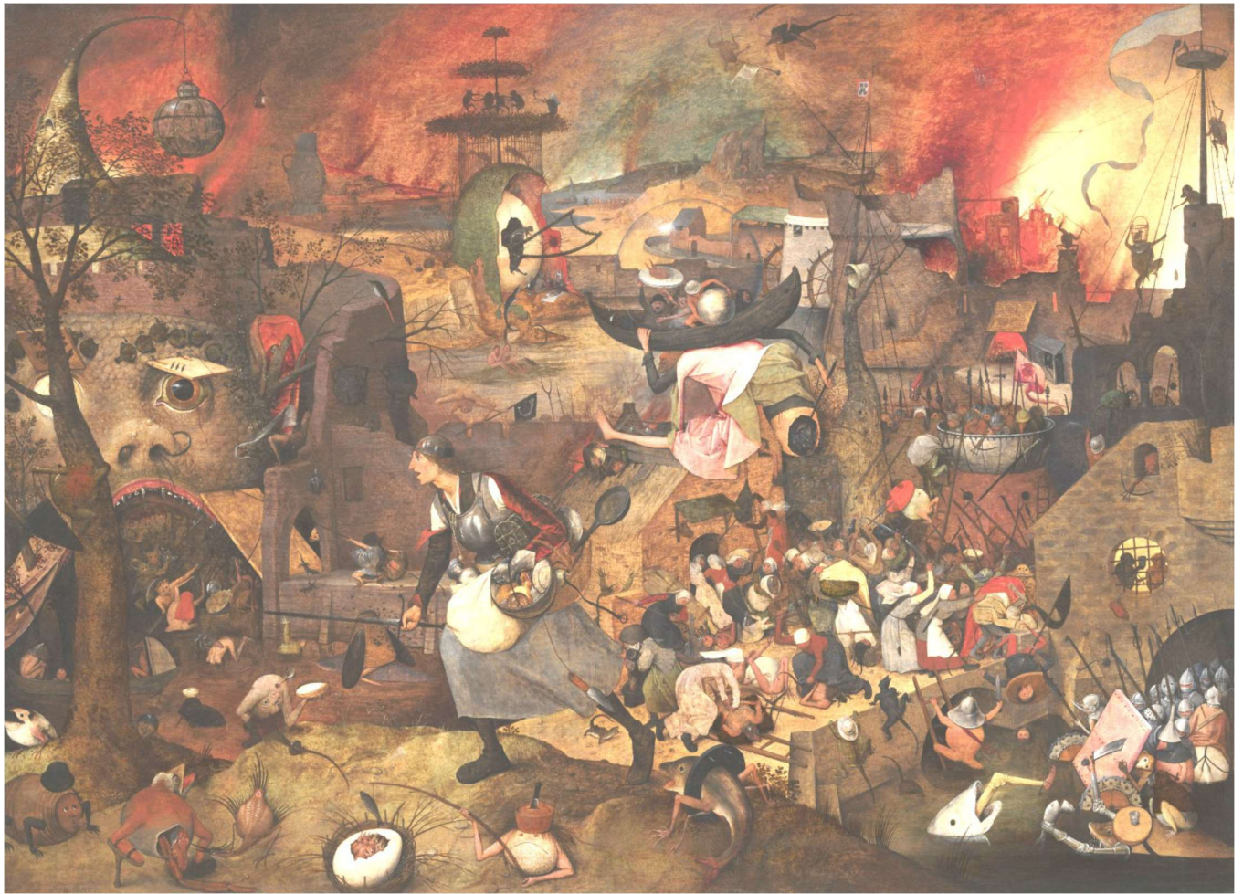
De gerestaureerde Dulle Griet terug, na haar verblijf in Wenen