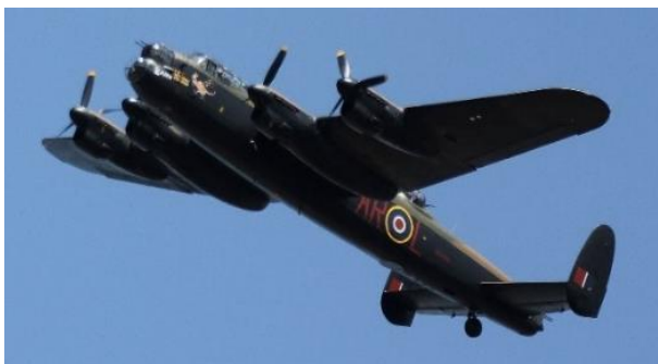
Lancaster die op 4 mei flypast zal uitvoeren

Belangstellenden worden verwacht op het terrein aan de Molen (Molenstraat-Houtakkerstraat) , die voor de gelegenheid in werking zal zijn.